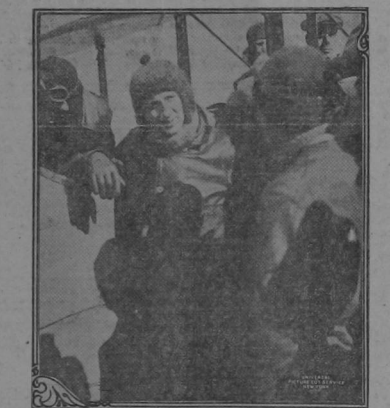
There have been innumerable theatrical artists of world wide reputation, that answering to the call of their countries, have enlisted in the ranks of the big struggle, and unfortunately for the art world, have paid the cost of their lives to the battle fields of their patriotic enthusiasm.

To the north of the Podgora heights we captured 525 Italian prisoners, including 13 officers. In the Piobesen section the enemy, although being strongly reinforced, failed to retake